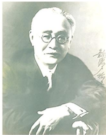
新渡戸稲造 (にとべいなぞう、 1862年9月1日(文久2年8月8日) -1933年(昭和8年) 10月15日) 日本の教育者・思想家。